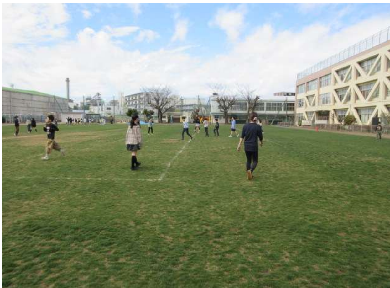
誰が鬼か分からない「ドキドキ鬼」をしました。鬼は、3人いるということでした。