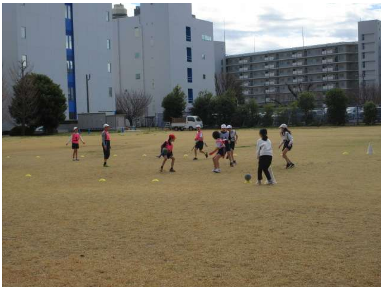
〔4年生〕生化学グラウンドで、体育をしました。