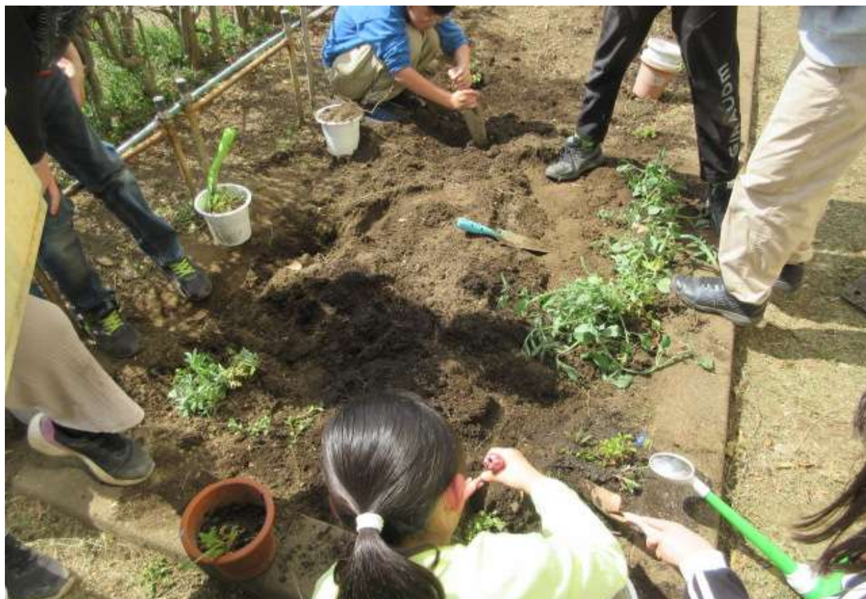
スイートピー・パンジー・ネモフィラを植えました。