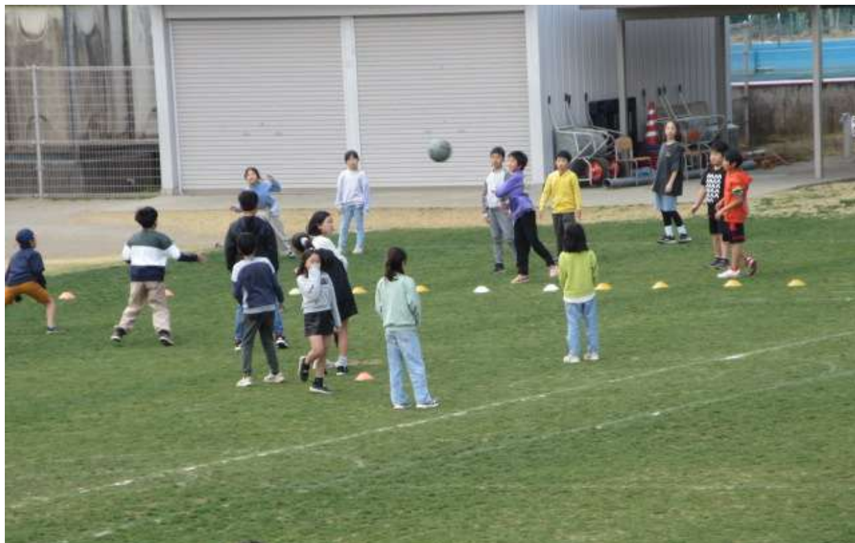
〔4年生〕お楽しみ会で、ドッジボールをしました。