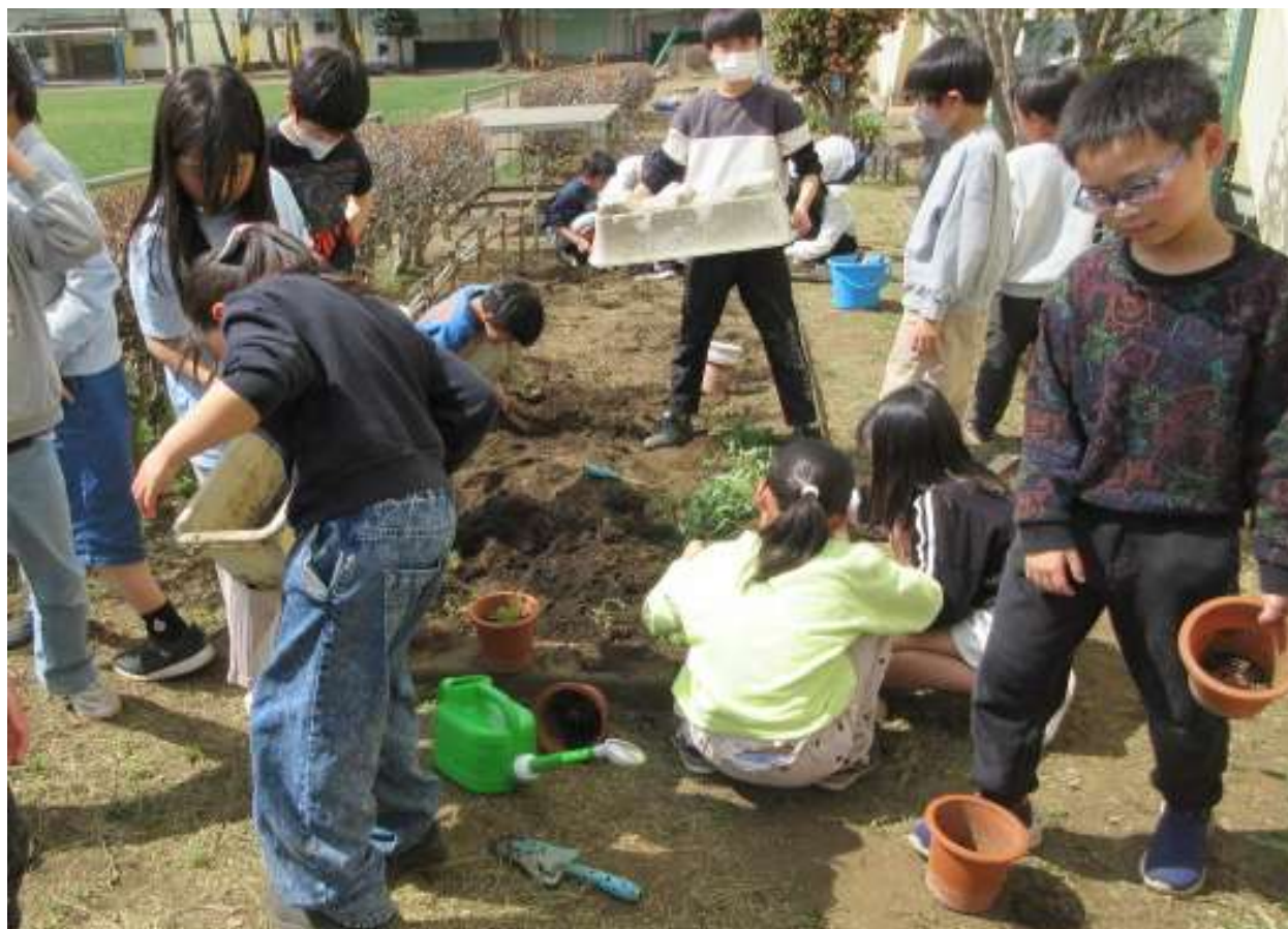
【3年生】花壇に花の苗を植えました。