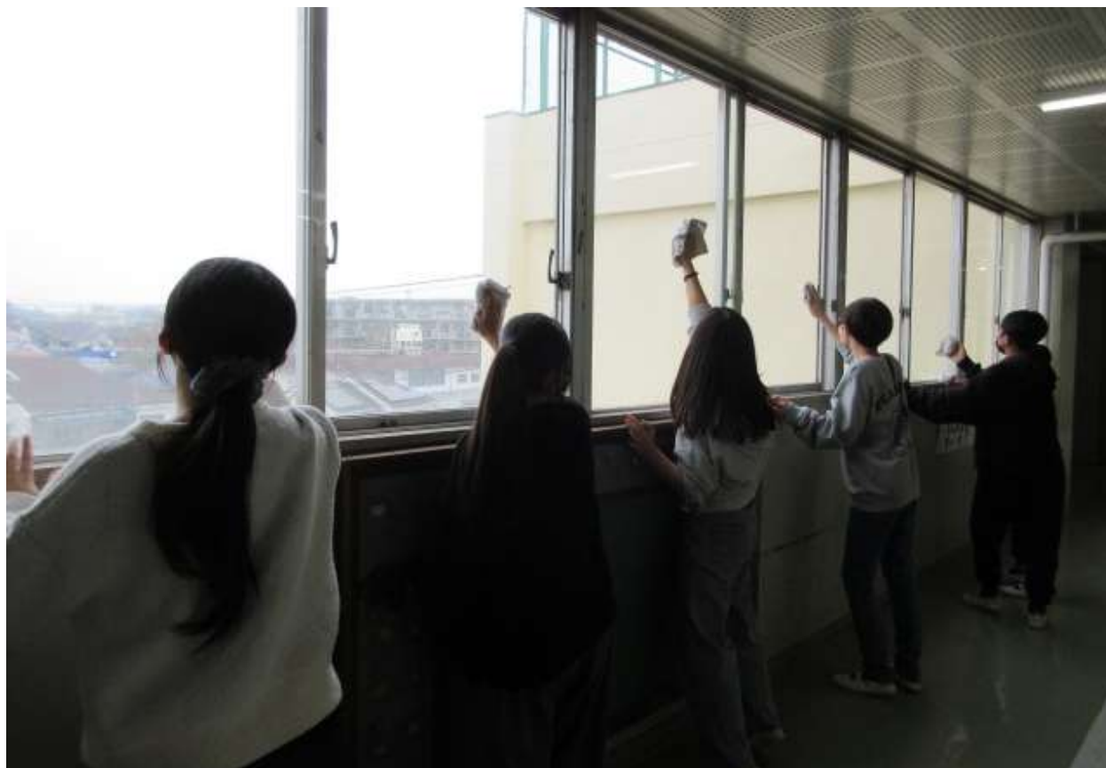
【6年生】卒業を前に、奉仕活動をしました。